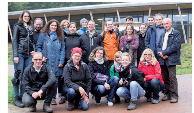
Unser Team für Ihr Anliegen