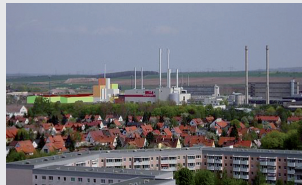
Auch in Spannungsfeldern von Industrie, Wohngebieten und Naturflächen führt GICON Umweltverträglichkeitsprüfungen durch